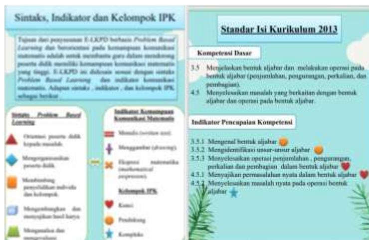
Gambar 2. Tampilan sintaks, Indikator, Kelompok IPK dan Standar Isi Kurikulum 2013

Pada Gambar 2 terdapat Sintaks Problem based Learning , indikator komunikasi matematis, dan Kelompok IPK yang disertai simbol-simbol untuk memudahkan dalam tahapan pembelajaran. Sedangkan Pada standar isi kurikulum 2013 berisi kompetensi dasar dan indikator dan indikator pencapaian kompetensi. Selanjutnya untuk tampilan isi E-LKPD disajikan pada Gambar 3.