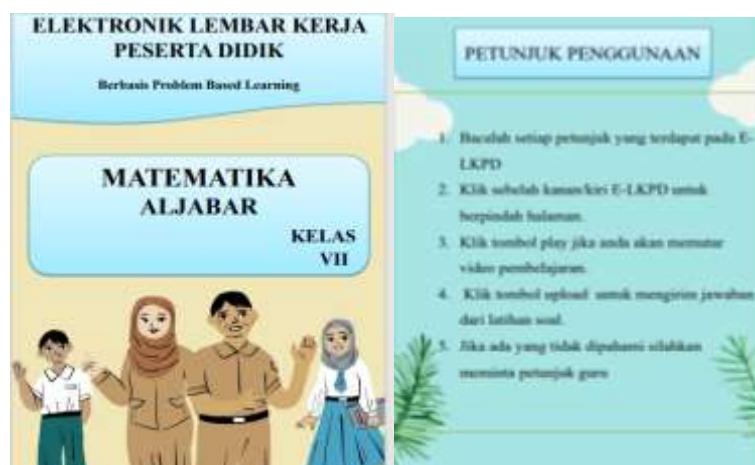
Gambar 1. Tampilan Halaman Depan (Cover) dan Petunjuk Penggunaan

Pada tahap ini peneliti mempersiapkan, mendesain, serta menyusun E-LKPD yang isinya disesuaikan dengan sintak PBL dan indikator kemampuan komunikasi matematis serta menyusun instrumen penilaian. Pembuatan desain E-LKPD menggunakan canva dan microsoft word , untuk membuat soal dalam bentuk video animasi menggunakan microsoft power point , kinemaster dan yocut video editor . Kemudian file E-LKPD digitalkan menggunakan aplikasi Flip PDF Professional . Adapun fitur tampilan E-LKPD disajikan pada Gambar 1 berikut.