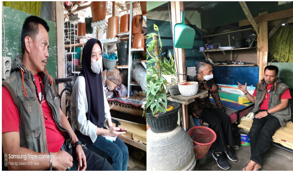
Gambar 1, Pendampingan PKM, lokasi tanaman hias Citamiang