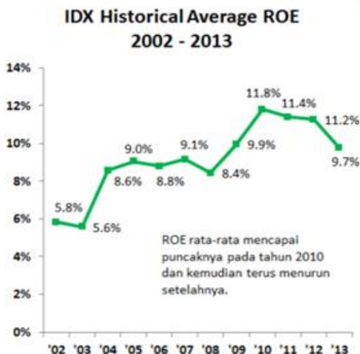
Gambar 1. Profitabilitas Periode Tahun 2002-2013

Data penurunan profitabilitas pada perusahaan di Indonesia dapat dilihat pada gambar 1 dan gambar 2 berikut ini: