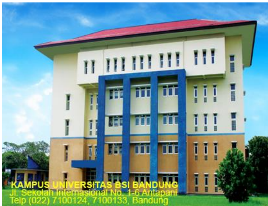
Gambar Kampus Universitas BSI Bandung

http://media.viva.co.id/thumbs2/2014/10/10/272791_pabrik-coolpad_641_452.jpg