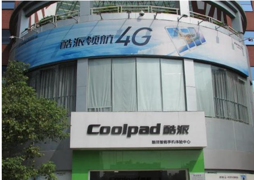
Gambar Perusahaan PT Coolpad