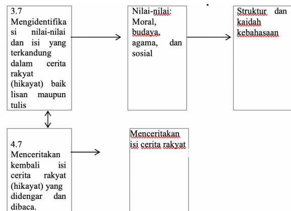
Gambar 1. Peta konsep

Hasil analisis di atas dijadikan bahan dasar untuk menyusun bahan ajar. Desain awal bahan ajar tersebut selanjutnya divalidasi dosen ahli dan guru bahasa Indonesia dari aspek kelayakan isi, penyajian materi, bahasa, dan grafika. Desainnya yaitu sampul depan dan belakang. Identitas bagian inti pada kegiatan belajar 1 terdapat contoh teks cerita rakyat disertai dengan materi mengidentifikasi nilai-nilai cerita rakyat; Kegiatan belajar 2 memuat contoh teks cerita rakyat disertai materi mengidentifikasi isi cerita rakyat serta kaidah kebahasaan; dan tugas. Adapun kompetensi yang diajarkan yaitu KD 3.7 dan KD 4.7. Menceritakan kembali isi cerita rakyat.